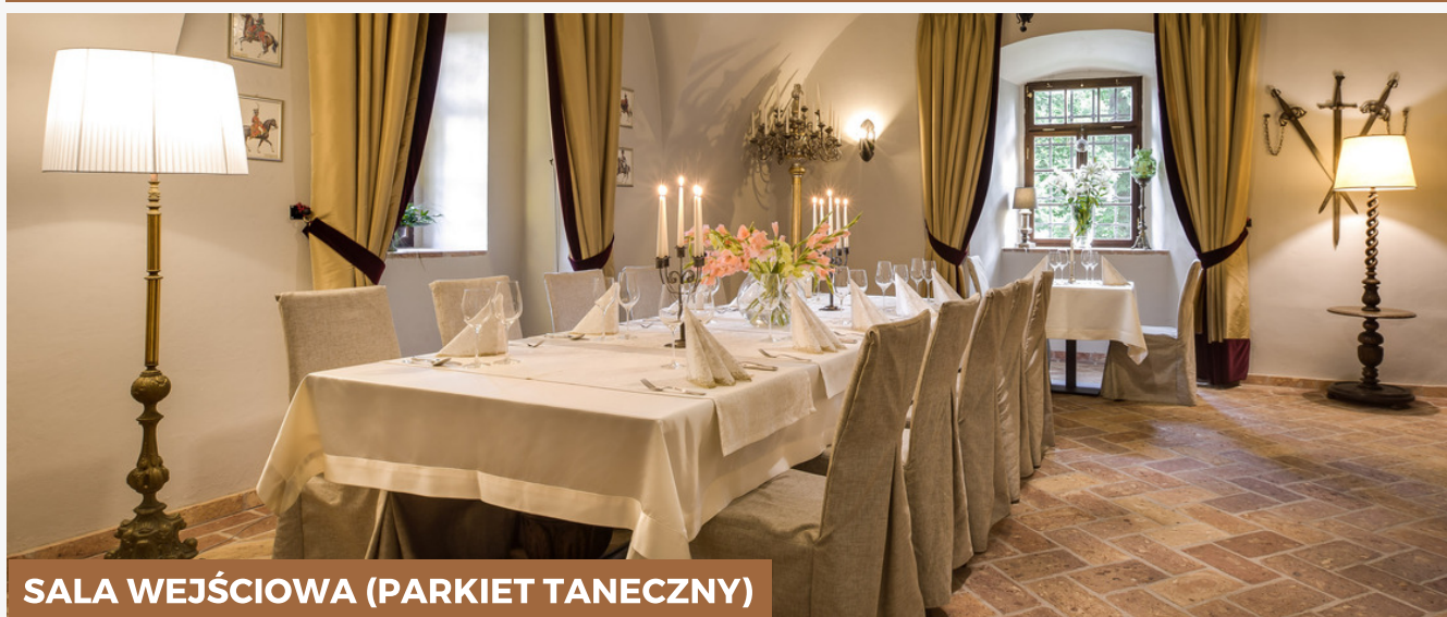
SALA WEJŚCIOWA (PARKIET TANECZNY)